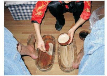
Genießen: z.B. TCM-Fußmassage, 90 Min. für ca. 8 Euro